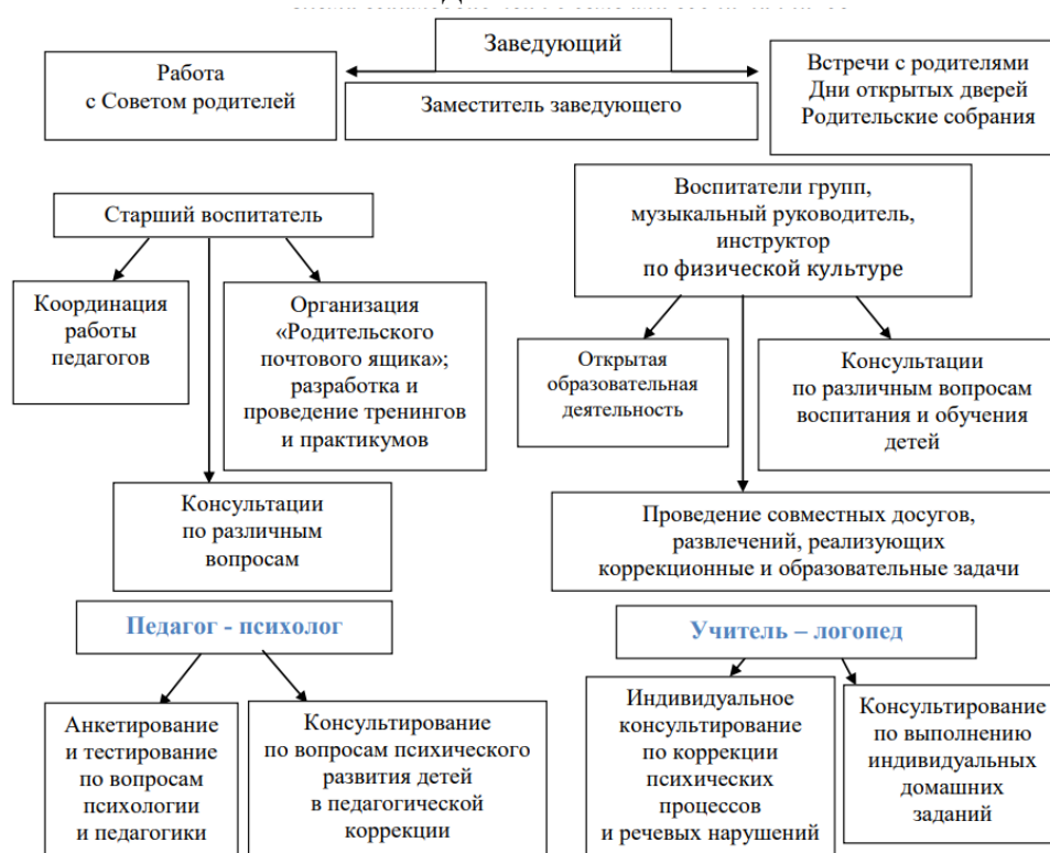
Схема взаимодействия с семьями воспитанников